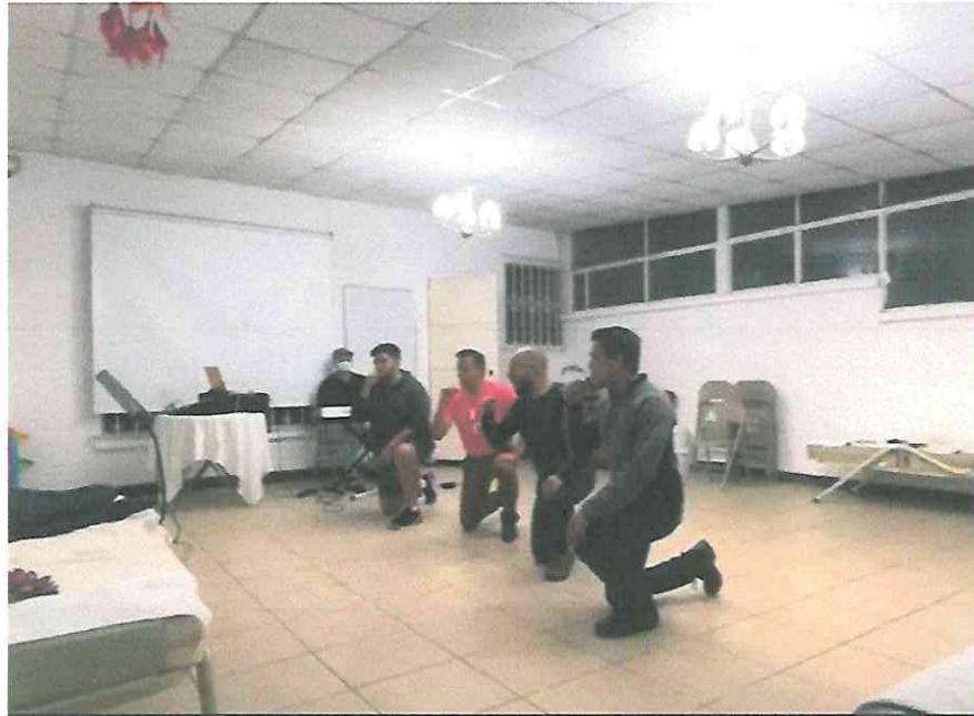
Esperanto Ensayo Repertorio

Adjunto fotografías de algunos ensayos que realizamos previos a la gira de presentaciones realizadas entre el 01 y el 11 de septiembre del 2022