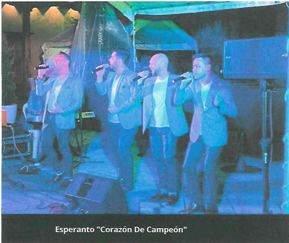
Esperanto "Corazón De Campeón"