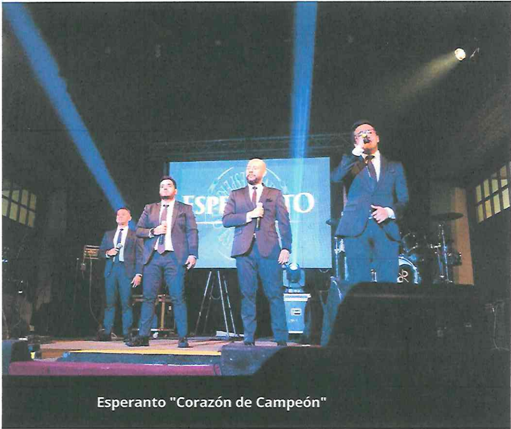
Esperanto "Corazón de Campeón"