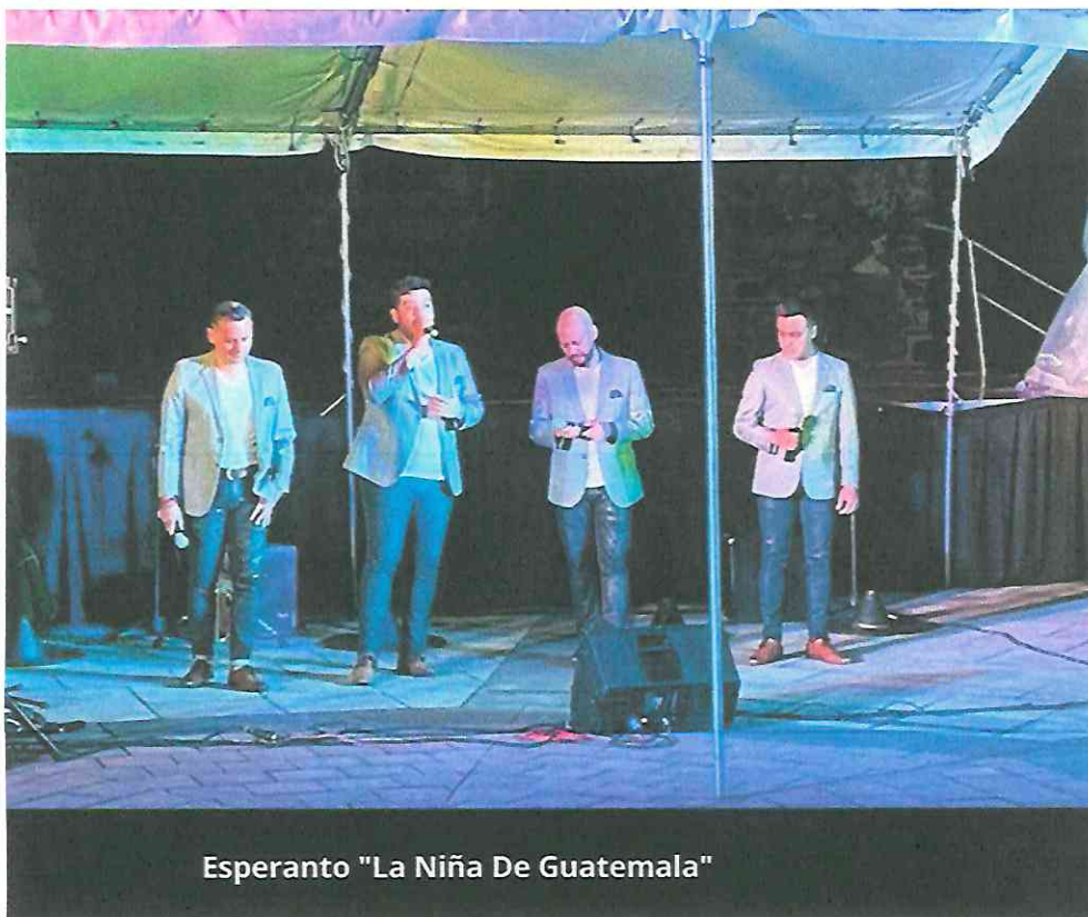
Esperanto "La Niña De Guatemala"