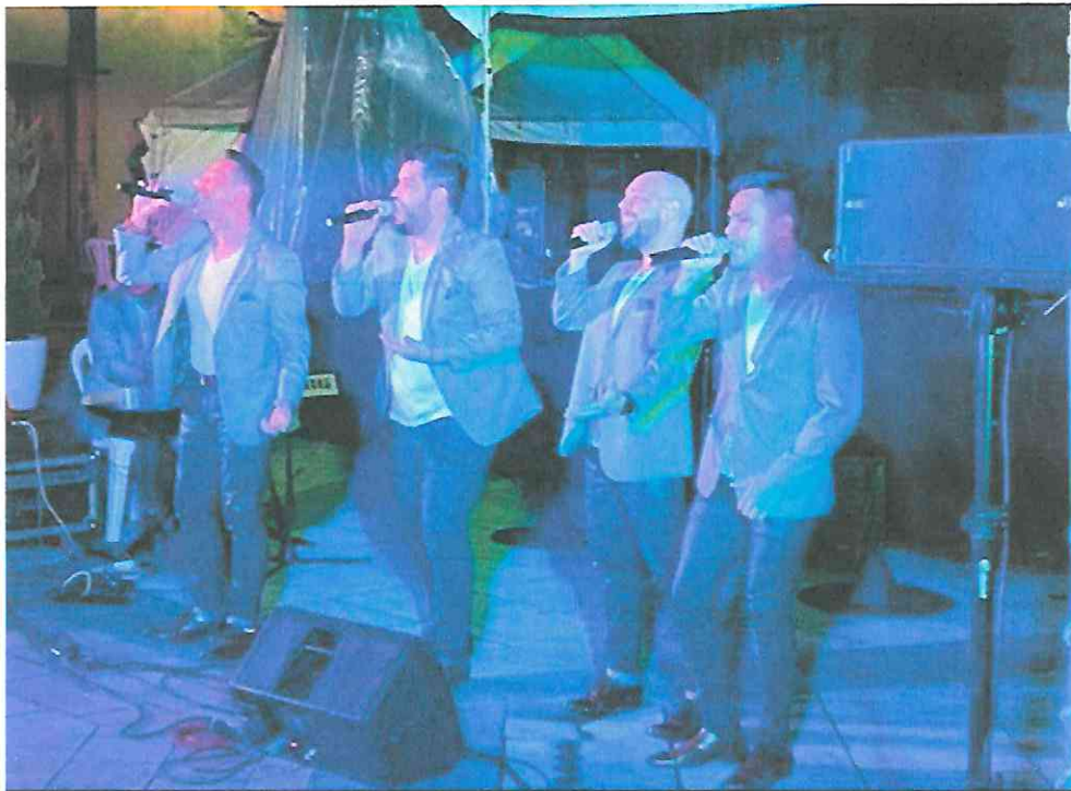
Esperanto "A Luchar Por La Vida"