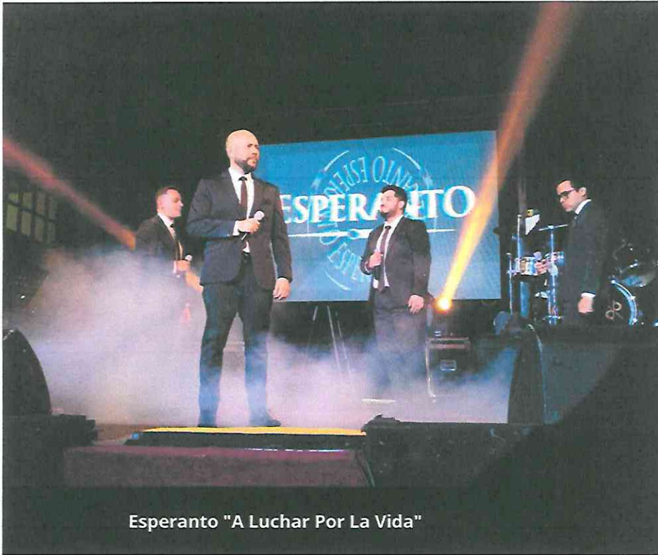
Esperanto "A Luchar Por La Vida"