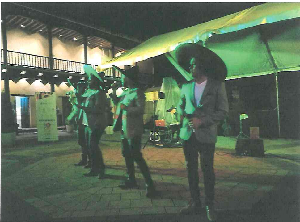
Esperanto "El Sombrerón"