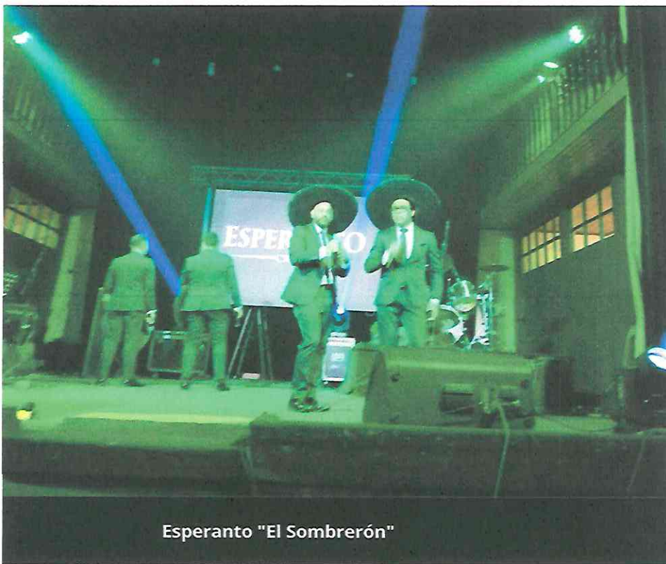
Esperanto "El Sombrerón"