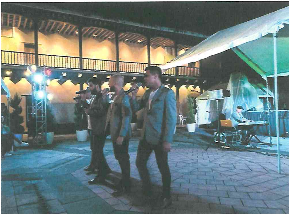
Esperanto interpretando "Citlatzín"