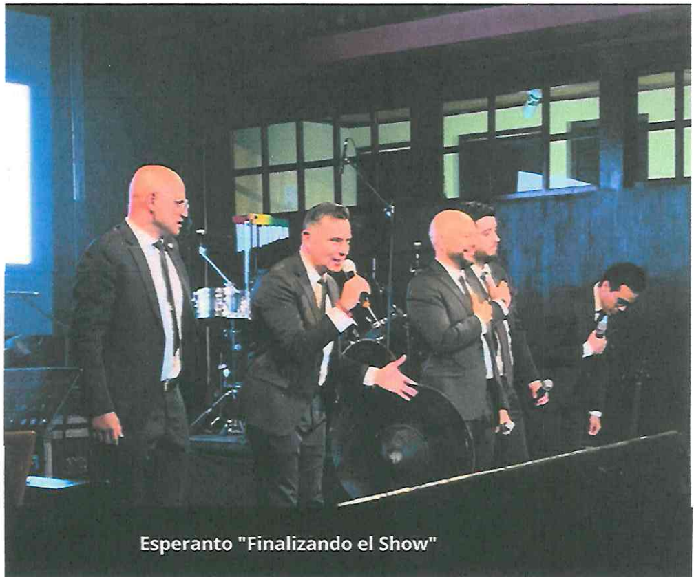
Esperanto "Finalizando el Show"