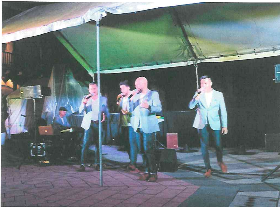
Esperanto "Corazón de Campeón"