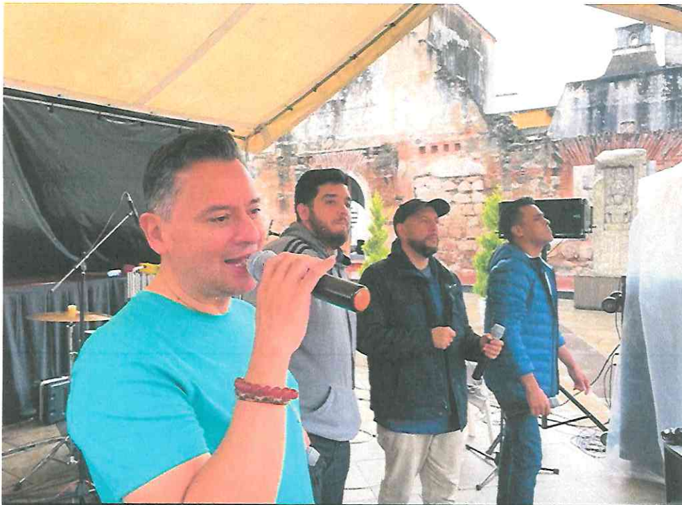
Esperanto "Prueba de Sonido"