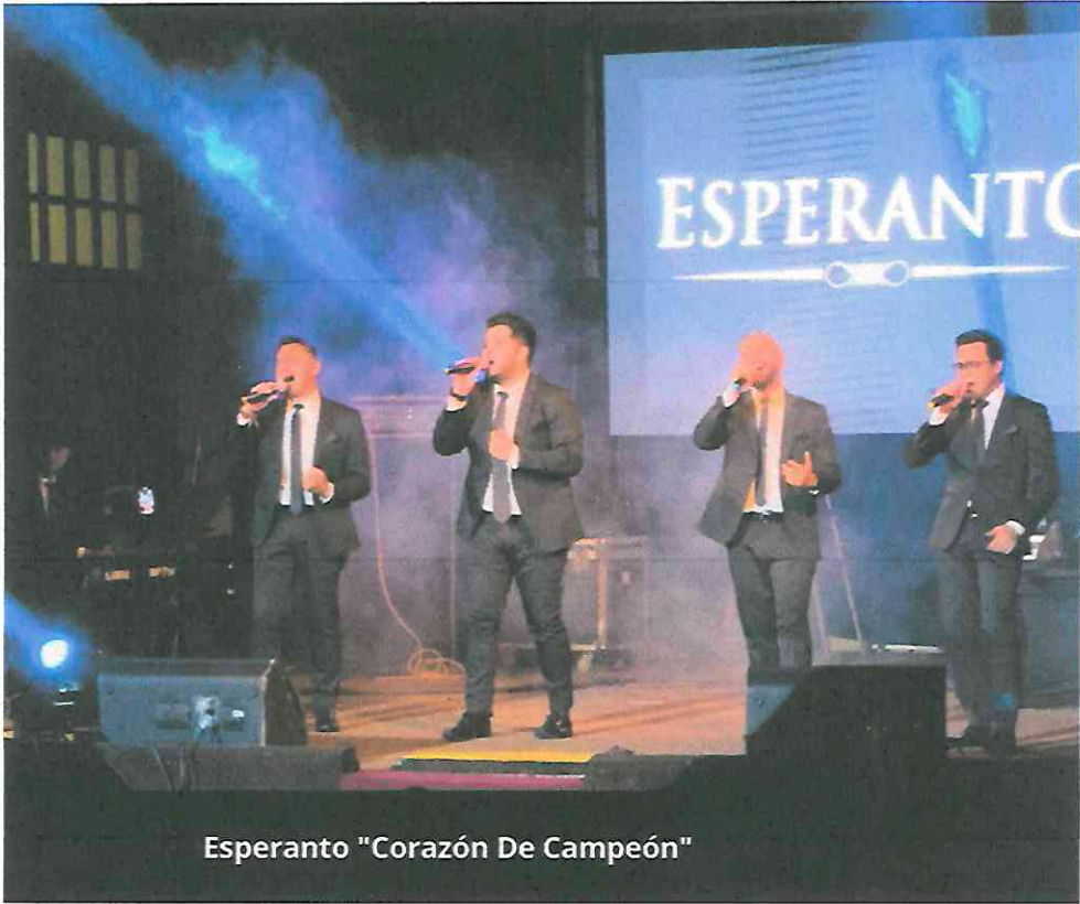
Esperanto "Corazón De Campeón"