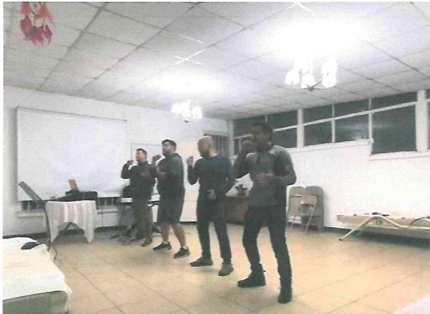
Esperanto Ensayo Repertorio