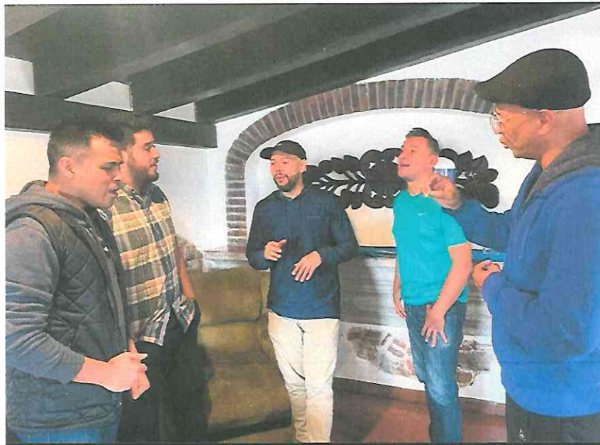
Esperanto Ensayo Repertorio - Espacios