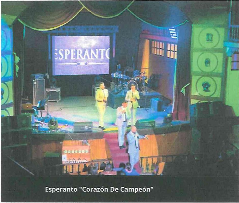
Esperanto "Corazón De Campeón"