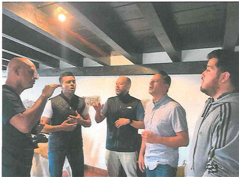
Esperanto Ensayo Repertorio - Espacios